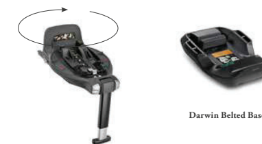
Darwin 360° i-Size Base

Height-adjustable headrest with central mechanism. The 3-point safety harness is incorporated into the headrest and is height-adjustable to grow at the same pace as your child.